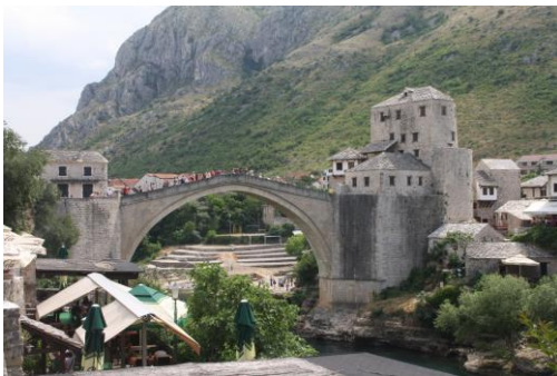
Brug van Mostar

Locatie Het NIVON-gebouw, Lodewijkstraat 1 te Hengelo Tijd 20.00 uur