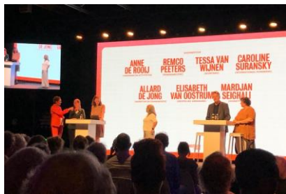
Bestuur landelijk HV 2022

Een informele inloop met koffie, broodjes en fruit was welkom na onze treinreis. We kwamen spontaan in gesprek met een ander lid uit de afdeling Utrecht e.o.