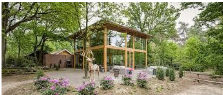
"migratie" met Monika Sie Dhian Ho en "koppig optimisme"

Zondag 14 januari 2024 van 10.30 - 16.00 uur Restaurant Florilympha, Lutterzandweg 16-1, 7587 LH De Lutte