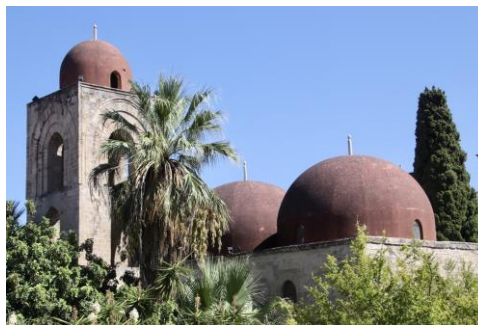
Arabische kerk in Palermo

Opm.: In de PowerPoint-presentatie zijn ook een aantal klankbeelden opgenomen