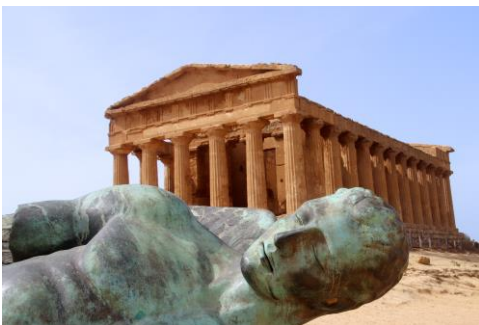
Griekse tempel in Agrigento

Ten slotte rijden we de Etna op, tot aan het hoogst bereikbare punt en beklimmen daarna daar de helling tot aan de liften naar de top, maar helaas zijn deze dan niet in gebruik.